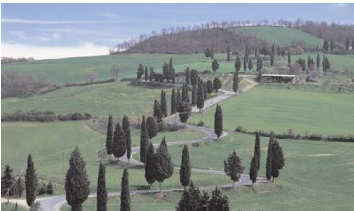
Paesaggio nei pressi di Pienza

Sono quasi 1000 (960 per l'esattezza) le aziende nate in Toscana grazie al progetto Smoat , l'iniziativa di microcredito a cui la Regione ha dato vita nel 2007 insieme a Fidi Toscana . Nel 2009 i prestiti sono stati 304 (con un trend in crescita rispetto agli anni precedenti), 76 nei primi mesi del 2010. I 960 microimprenditori hanno usufruito di un finanziamento da parte delle banche convenzionate per un importo complessivo di quasi 12 milioni di euro. Dei prestiti erogati, 452 sono andati ad imprese straniere, per un valore complessivo di 4 milioni e 510 mila euro. I prestiti ad imprese femminili sono stati 265, per un valore di 3 milioni e 662 mila euro, quelli ad imprese giovanili 428 per quasi 6 milioni di euro. È del 99% il tasso di sopravvivenza delle imprese create attraverso il microcredito. Elevato anche il tasso di solvibilità: il 93% delle somme erogate è stato restituito.