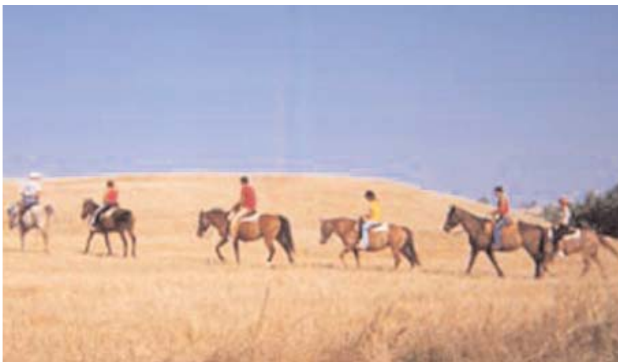
A cavallo sulle colline toscane