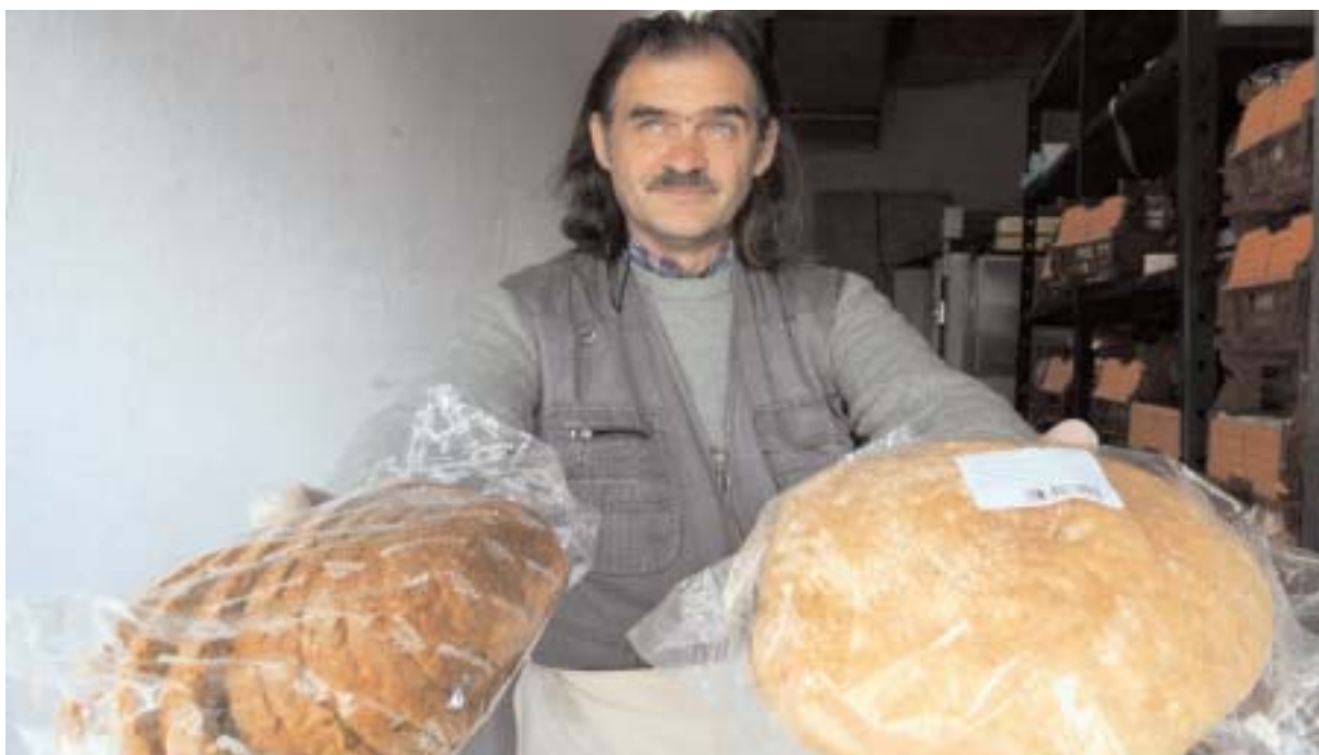
Il tipico pane toscano ( fotogramma)

In Toscana si registra un calo delle vendite di merci non alimentari (-3,6%), prodotti alimentari (-1,8%), e in calo anche il valore delle vendite di ipermercati, supermercati e grandi magazzini (-1,3%). Peggio rispetto al -0,6% registrato in Italia. Un segnale positivo però arriva dalle aspettative degli imprenditori sull'andamento delle vendite nel II trimestre 2010, che sembrano indicare un recupero di ottimismo.