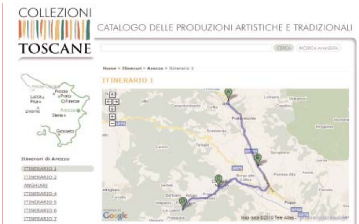
Uno degli itinerari consigliati

È stata inaugurata la nuova sede fiorentina di Fiorgen Onlus Fondazione per la Farmacogenomica . L'organizzazione non lucrativa di ricerca, che si pone nella fascia alta degli istituti di ricerca biomedica in Italia, opera a cavallo fra il polo scientifico e i poli medici di Careggi e Ponte a Niccheri e vuol fare della nuova sede l'anello di congiunzione tra mondo della ricerca e realtà fiorentina. Fiorgen conta dodici ricercatori scelti, che vantano oltre 100 pubblicazioni scientifiche l'anno, e un pari numero di collaboratori esterni, per lo più dell' Università di Firenze . Fiorgen, in maniera inusuale per l'Italia, si è fatta valutare da tre eminenti professori per ragioni di trasparenza verso i donatori/finanziatori. Il consiglio scientifico ha deciso di chiedere al ministero della Ricerca di includere Fiorgen tra le istituzioni da essere valutate per la ricerca (Comitato Italiano per la valutazione della Ricerca, Civr).